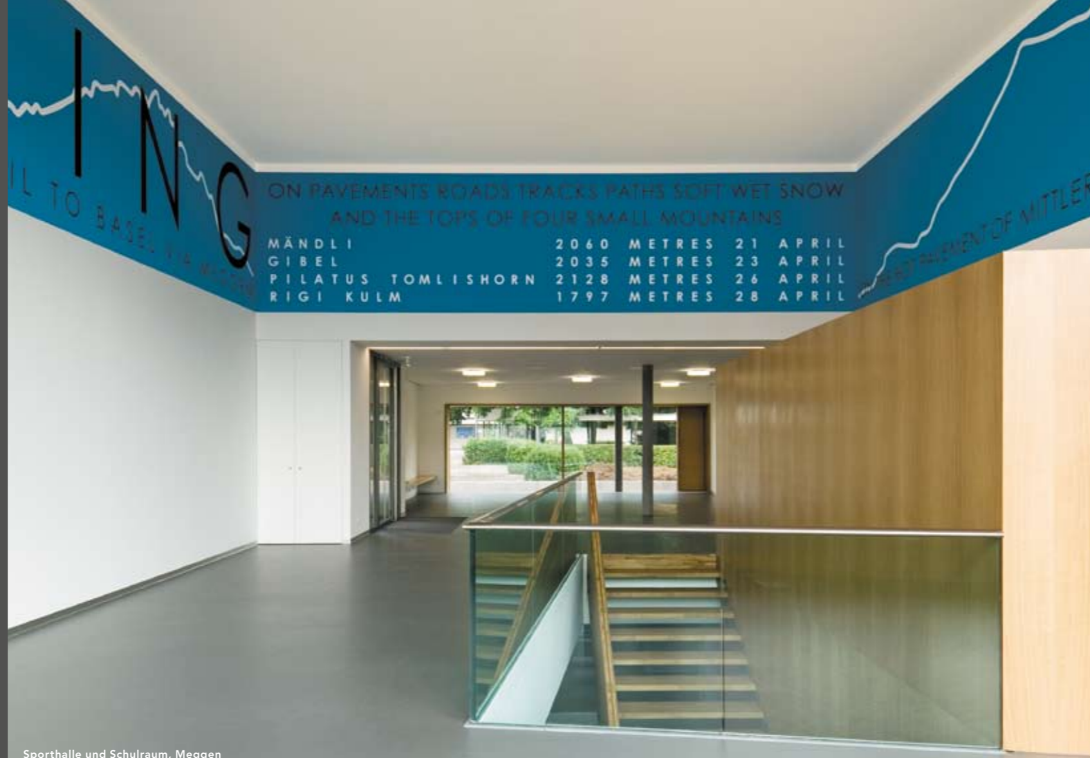
Sporthalle und Schulraum, Meggen

Wettbewerbskommission visarte zentralschweiz Präsident Markus Boyer, dipl. Architekt ETH/SIA Steinhofstrasse 44, 6005 Luzern Fon 041 318 30 60, Fax 041 318 30 50 wettbewerbskommission@visarte-zentralschweiz.ch www.visarte-zentralschweiz.ch