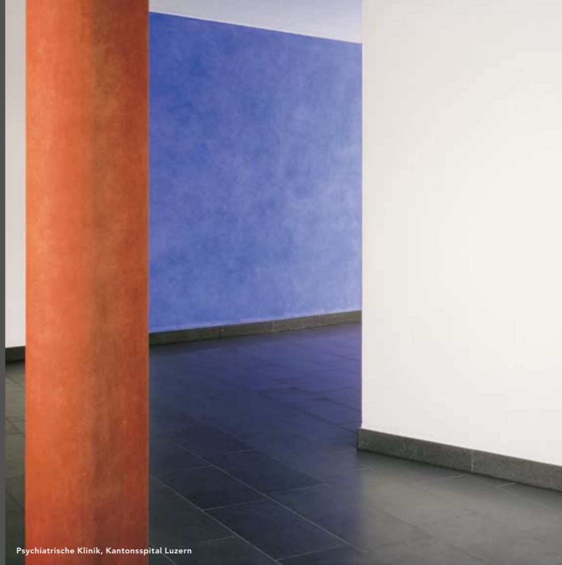
Psychiatrische Klinik, Kantonsspital Luzern

Malerinnen oder Bildhauer, Rauminstallations- oder Konzeptkünstler?